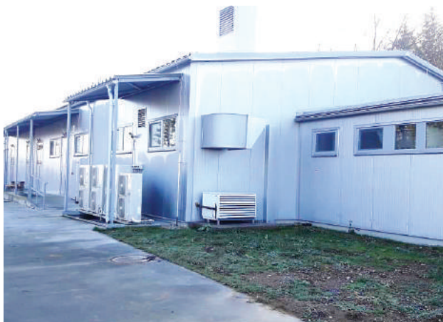
Jedným z plánov PD Ďumbier bolo sprevádzkovať mliekareň.

Obyvatel' by mal dostať šancu kúpiť si základné potraviny domáce a čerstvé. Je to prvý predpoklad, že ide naozaj o kvalitný, chutný, zdravý výrobok, bez zbytočných konzervantov, chemických stabilizátorov a podobných látok.