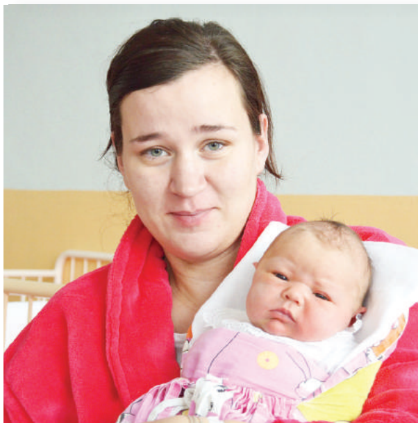
Prvé dieťaťko v novom roku.