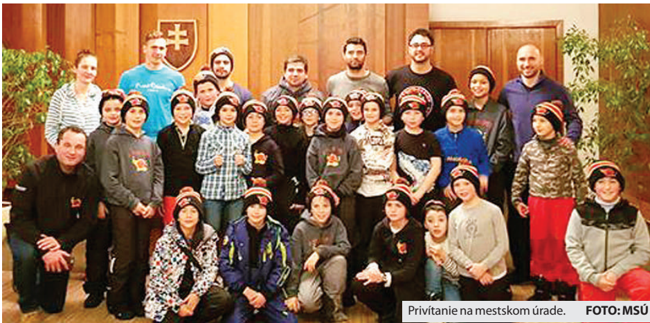
Prívitanie na mestskom úrade.