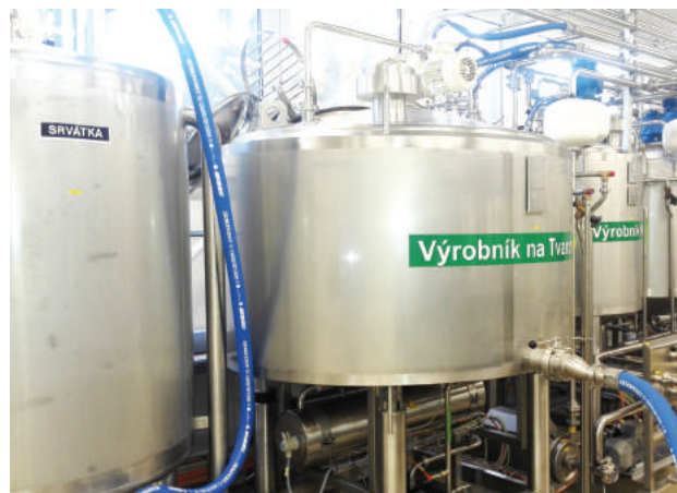
Vyrábajú maslo, tvaroh a pribudnú aj ďalšie produkty zdravej výživy.