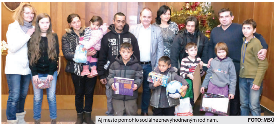
Aj mesto pomohlo sociálne znevýhodneným rodinám.