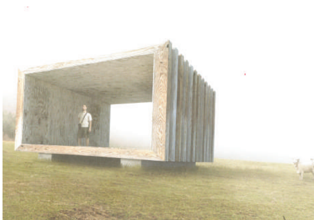
Brezno možno bude mať aj Windows.

Myšlienka tohto projektu sa zrodila pred deviatimi rokmi v bratislavskom architektonickom ateliéri s požiadavkou poukázať na to, čo nefunguje, hoci na to často už dávno existuje riešenie. Odhaľuje potenciál miest, okolo ktorých denne chodíme, no mnohokrát ich nevnímame. Do projektu Mestské zásahy 2017 sa zapojilo už niekoľko miest zo Slovenska a tohto roku si príležitosť nenechalo ujsť ani Brezno. Hlavným