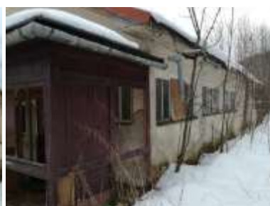
Fotka č. 5 Pohľad severný