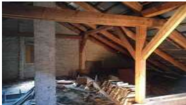
Fotka č. 22 Krov