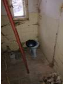
Fotka č. 19 WC 01.10