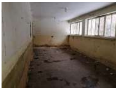
Fotka č. 11 Učebňa 1.03