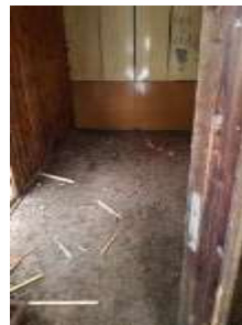
Fotka č. 26 Sklad dreva