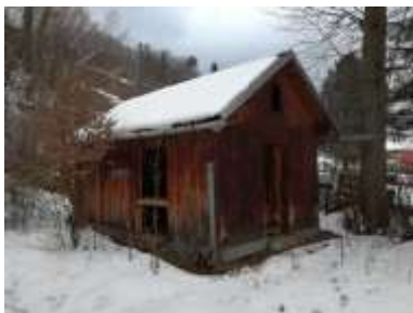
Fotka č. 25 Sklad dreva