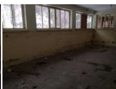
Fotka č. 15 Učebňa 1.03