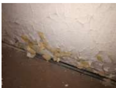
Fotka č. 17 Poškodená omietka od vlhkosti