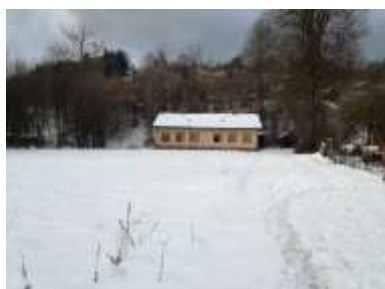
Fotka č. 1 Pohľad na školu východný