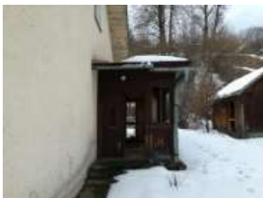
Fotka č. 10 Drevená veranda