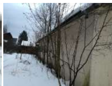
Fotka č. 6 Pohľad severný