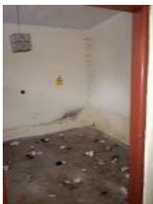
Fotka č. 13 Učebňa 1.07