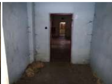
Fotka č. 12 Kabinet 1.04