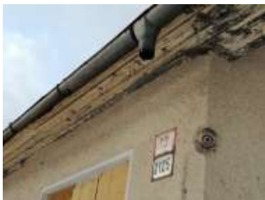
Fotka č. 7 Chýbajúce zvody sokel