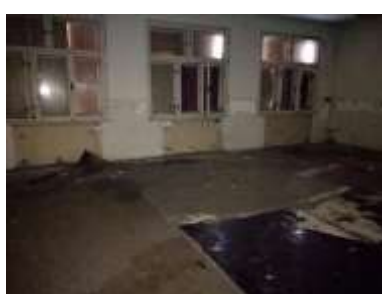
Fotka č. 14 Učebňa 1.05