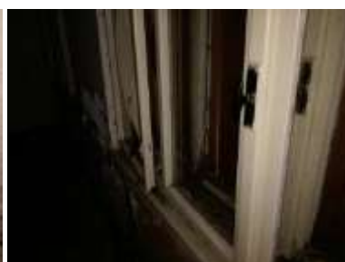
Fotka č. 18 Poškodené okná