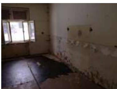
Fotka č. 16 Poškodená podlaha