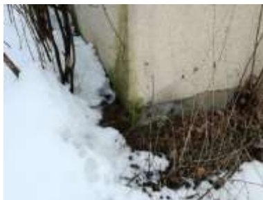
Fotka č. 8 Poškodený roh budovy