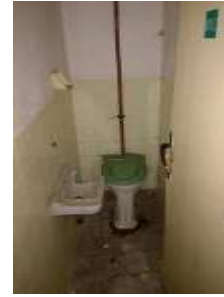
Fotka č. 21 WC 01.12