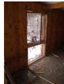
Fotka č. 27 Sklad dreva