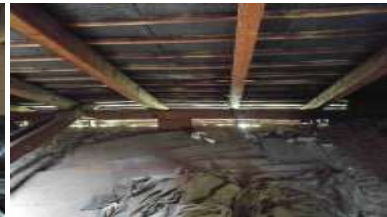
Fotka č. 24 Krov