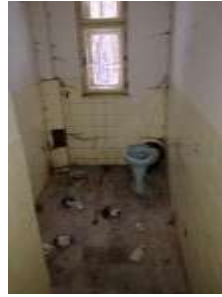
Fotka č. 20 WC 01.11