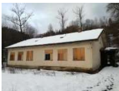
Fotka č. 2 Pohľad južný