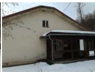
Fotka č. 3 Pohľad