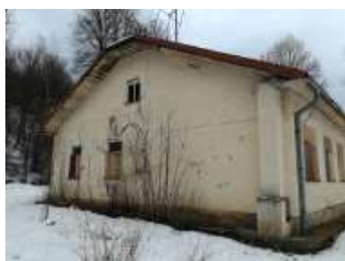
Fotka č. 4 Pohľad západný