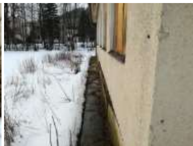
Fotka č. 9 Poškodený