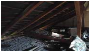
Fotka č. 23 Krov